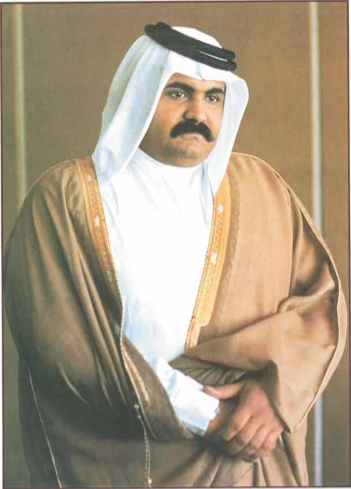
صاحب السمو الشيخ حمد بن خليفة آل ثاني ولي العهد وزير الدفاع