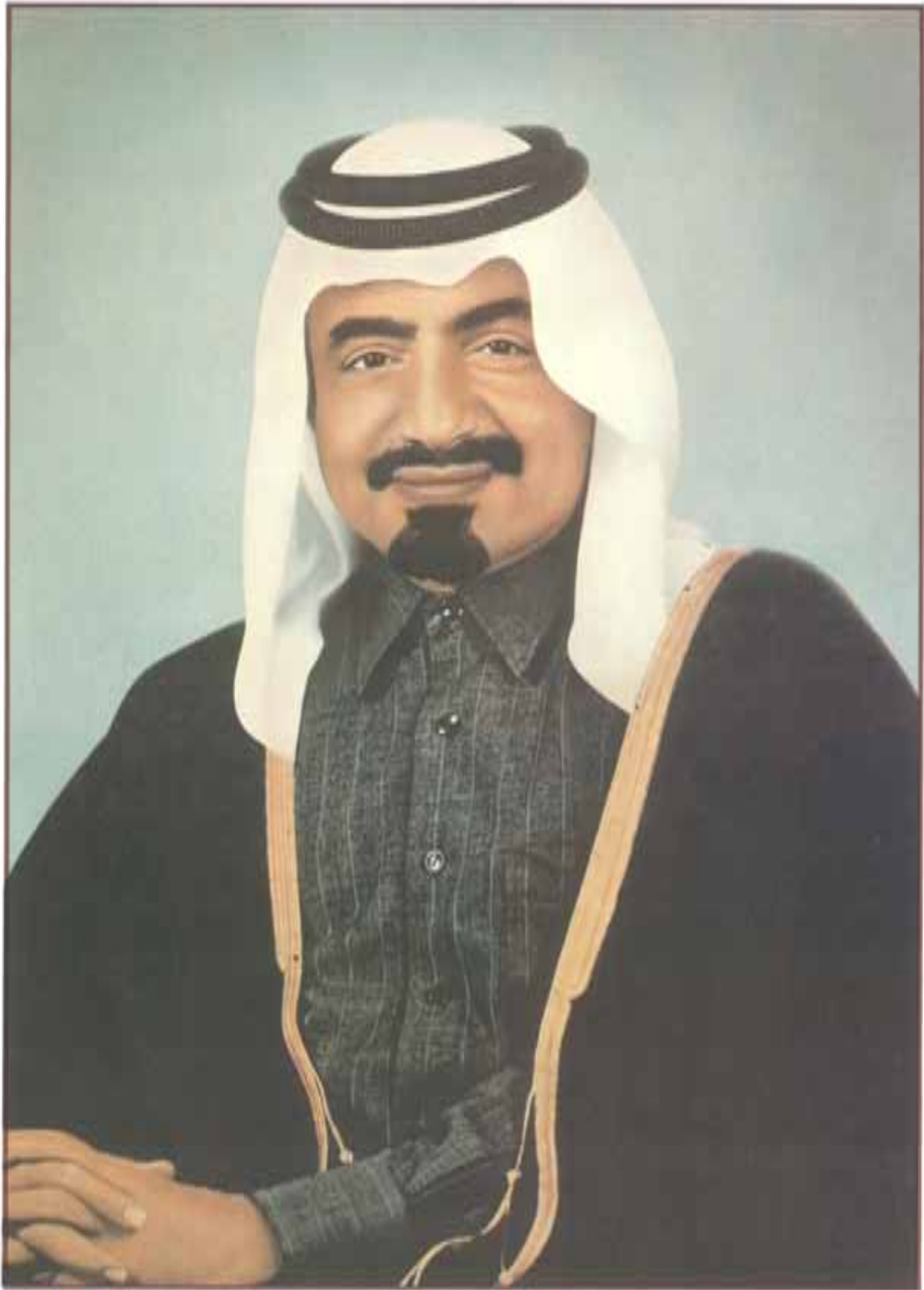
جائزة صاحب السمو الشيخ خليفة بن حمد آل ثاني