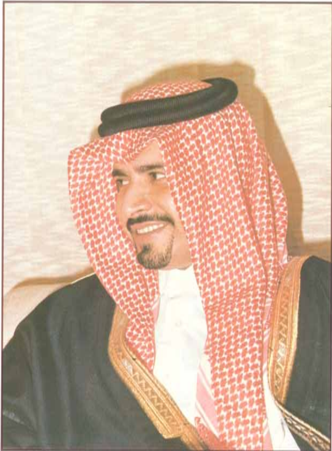
معالي الشيخ جبر الفوزان بن خليفة آل ثاني