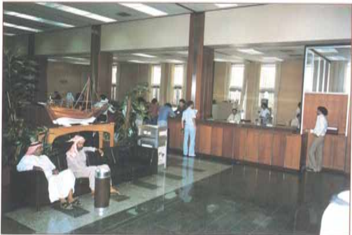
القاعة الرئيسية الفرع الرئيسي - الدوحة