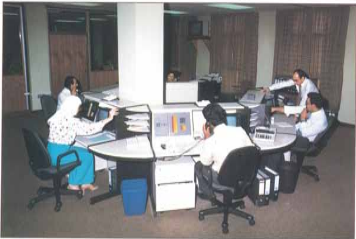
فرقة التعامل الإدارة العامة - الدوحة